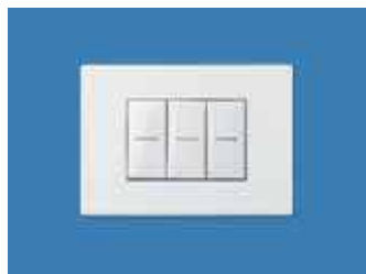
antes de pintar